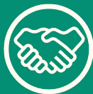
TOQUE OU APERTO DE MÃO