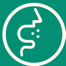
GOTÍCULAS DE SALIVA

A transmissão acontece de uma pessoa doente para outra ou por contato próximo (cerca de 2 metros), por meio de: