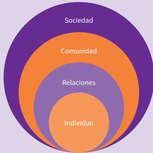
FIGURA 1. Modelo ecológico de la violencia según la OMS 8